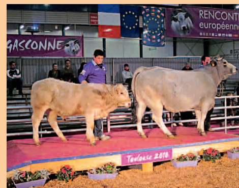
Couple mère-veau croisé lors du dernier Fleuron gascon à Toulouse en 2011

Une quarantaine de vaches est réservée au croisement charolais. « Nous n'avons pas de problème de vêlage actuellement. Les veaux croisés sont vifs, robustes et semblent moins fragiles. En moyenne, on estime la plus value à 60/80 euros pour un mâle croisé par rapport à un pur gascon et à 100/120 euros pour une femelle. Vu